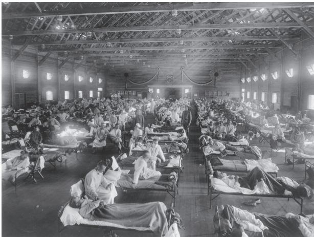
2. Slachtoffers van de Spaanse griep worden verzorgd in een ziekenhuis (1918).

Jonge kinderen, oude mensen, maar vooral opvallend veel twintigers, dertigers en veertigers: mannen en vrouwen in de bloei van hun leven. De begrafenisstoeten rijgen zich aaneen, het is een komen en gaan van doodskisten. Waar dat gebruikelijk is, worden lakens voor de ramen gehangen als teken dat er een dode te betreuren is. Begrafenisondernemers kunnen de lijkenvloed niet aan en moeten hulptroepen inschakelen om al die lichamen fatsoenlijk de laatste eer te bewijzen. Timmermannen maken overuren om kisten te vervaardigen. Er wordt tegen de klippen op gezopen om de ellende te vergeten. Door jong en oud, mannen en vrouwen, jongens en meisjes. Als excuus wordt gebruikt dat alcohol de kwalijke bacillen doodt. Ziekenhuizen stromen vol en over, artsen en verplegend personeel worden ziek zodat ziekenhuizen soms gesloten moeten worden. Scholen gaan dicht, evenals bioscopen en