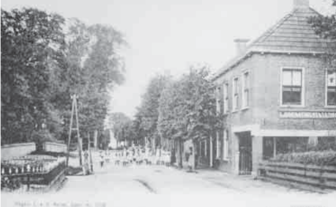
Jorwerd rond 1910, rechts de herberg – later café – en links achter het hek de oude haven

broden en koekjes. De scharrelaars die daarnaast woonden, kleine mensen die overleefden door klein te blijven: wat klusjes bij een boer, wat handel in petroleum. De werkmán, daarnaast, die ook in de zwarte brand zat. Oude Jantsje, die een kostganger had, een verdwaasde man, dat was zo met de familie geregeld. Evert Beton, dat was zijn bijnaam, vanwege zijn stramgewerkte spieren. Daarnaast het koemelkertje dat touw, carboleum en uierzalf verkocht, en zijn vrouw, die poetste bij de dorpspommeranten.